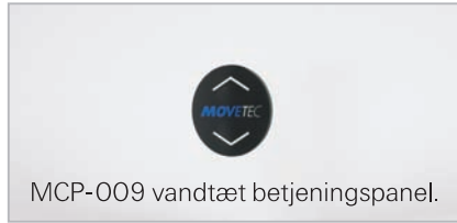
MCP-009 vandtæt betjeningspanel.