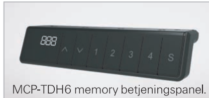
MCP-TDH6 memory betjeningspanel.