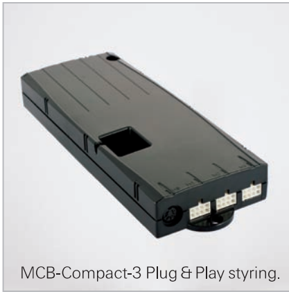
MCB-Compact-3 Plug & Play styring.